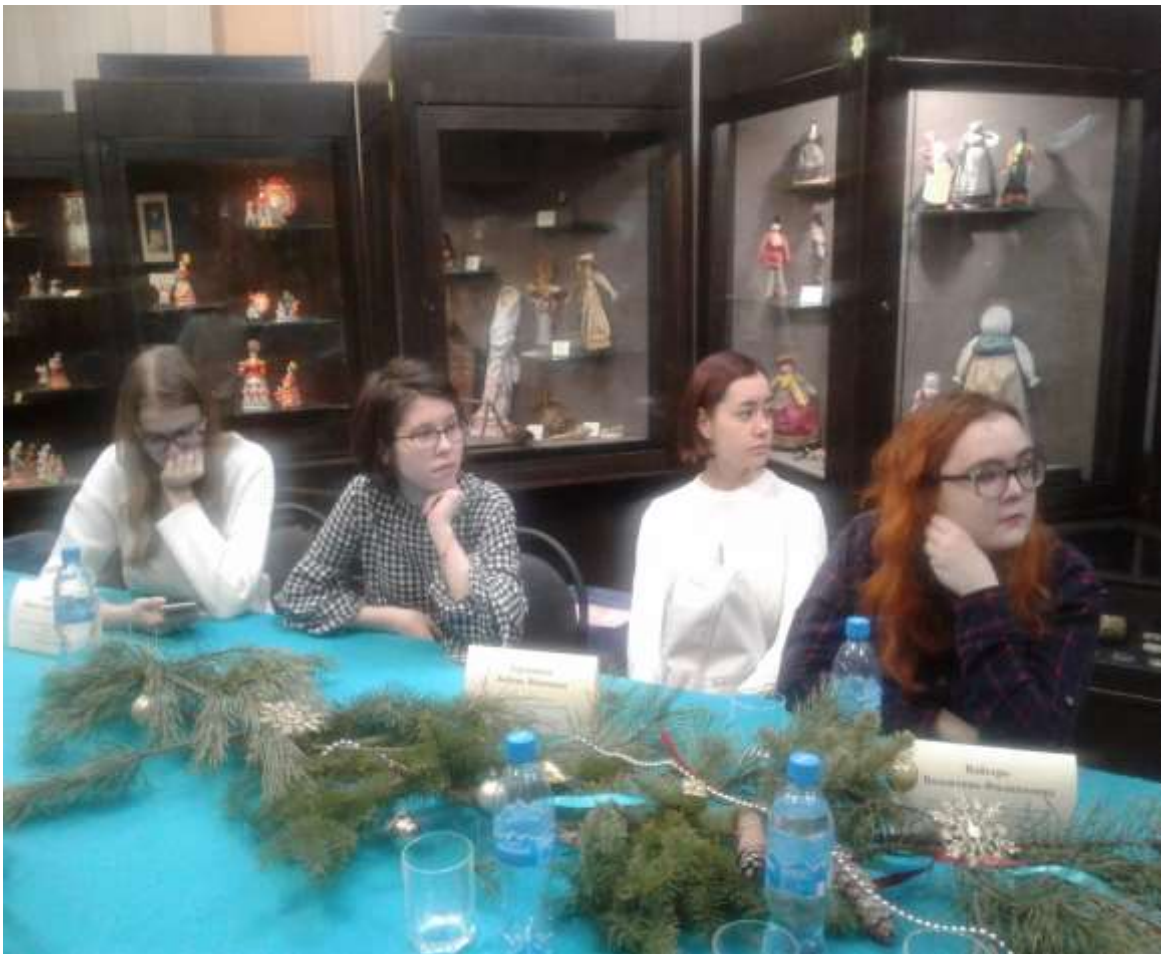
Рис. Студенты и ППС на чтениях