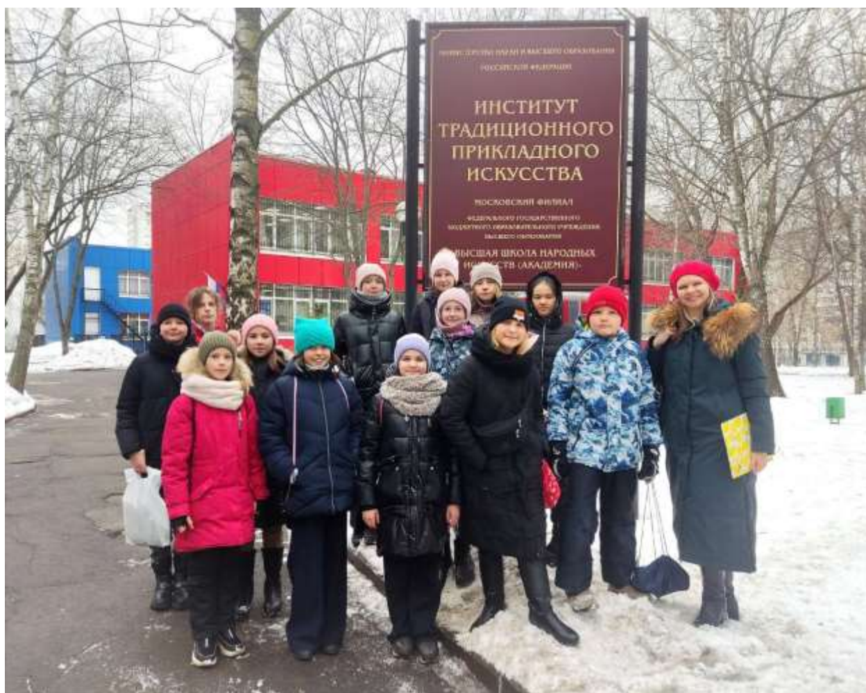
Институт традиционного прикладного искусства

3. Для обучающихся кружка "Арт студия" ГБОУ г. Москвы "Школа №534", была проведена беседа и экскурсия по мастерским, методическому кабинету Института традиционного прикладного искусства, где были наглядно проведены мастер-классы по выполнению изделий и продемонстрированы изделия, созданные студентами ИТПИ для своих выпускных квалификационных работ.