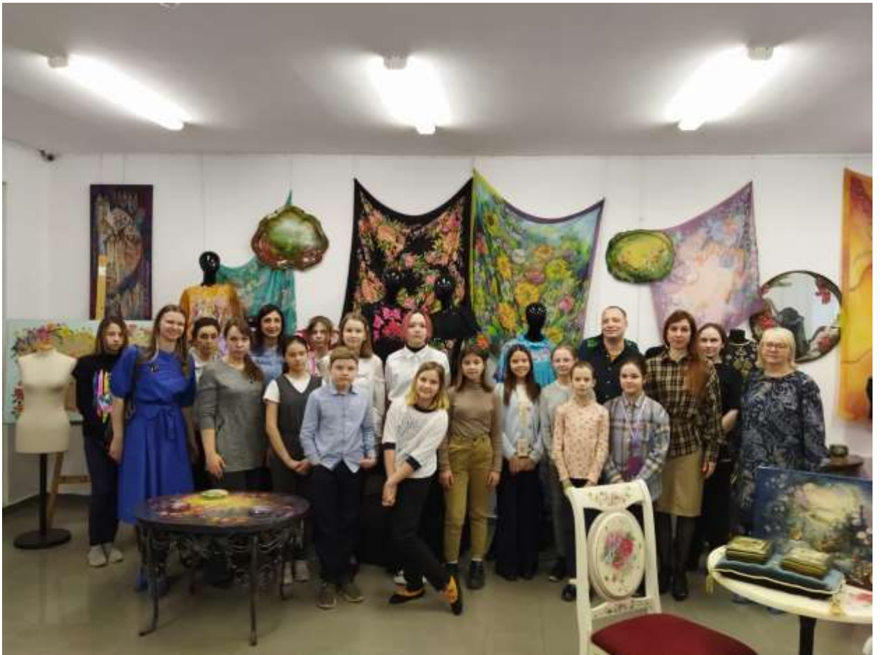
В методическом кабинете ИТПИ