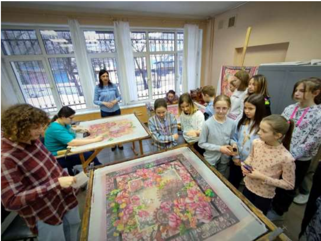
Мастер – класс в мастерской художественной росписи ткани