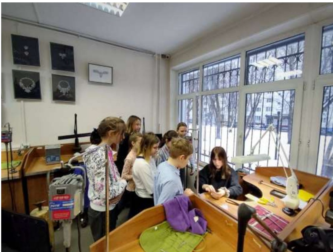
Мастер – класс в ювелирной мастерской ИТПИ