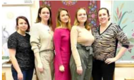
Творческий коллектив, создавший ёлочную игрушку «Архангельская краса»

самим авторам, но и потому, что именно искусство вышивания хранит в себе глубокие художественные традиции и национальное своеобразие каждого народа.