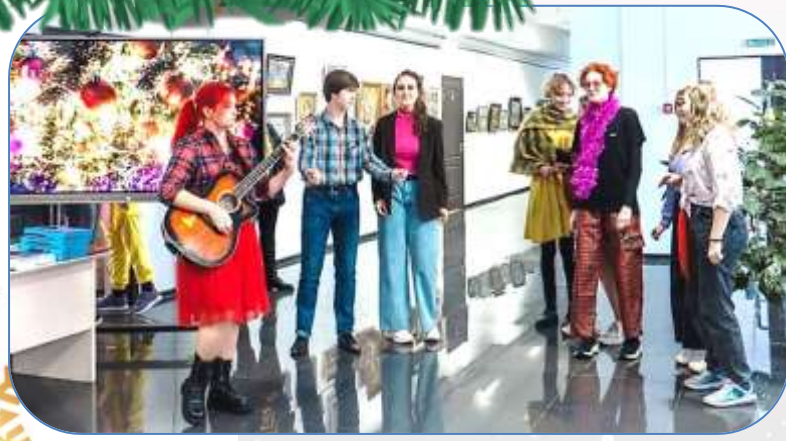
Фотографии сделаны на новогодних вечерах в Высшей школе народных искусств и Федоскинском институте лаковой миниатюрной живописи ВШНИ