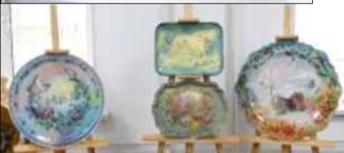
Фрагменты экспозиции выставки работ студентов филиалов ВШНИ «Праздники русской зимы».