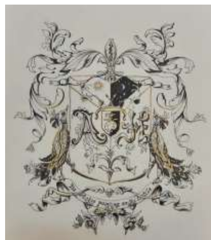
Автор А. Н. Новоселова