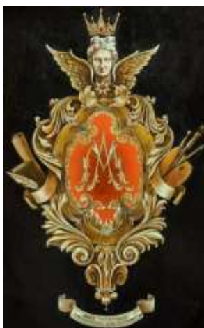
Автор А. О. Мелихова

Е.А. Лапшина, заведующая кафедрой художественного кружевоплетения ВШНИ