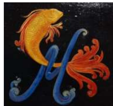
Автор М. Ю. Синельникова