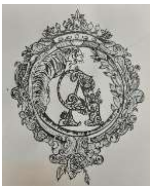
Автор А.М. Цепцова