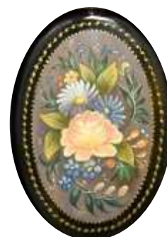
III место Часова Н. "Сказочное великолепие"