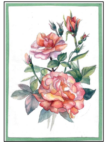
III место – открытка-зарисовка «Розы». Автор – Анна Цепцова