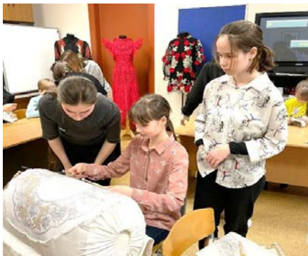
Ученица ДШИ пробует плести кружево на коклюшках

Помимо презентации ученикам и педагогам школы были представлены изделия из фонда ВШНИ: платья, выполненные выпускниками кафедр художественной вышивки, художественного кружевоплетения, художественной росписи ткани, поднос в технике нижнетагильской маховой росписи, а также учебные образцы, выполненные в различных техниках художественной вышивки.