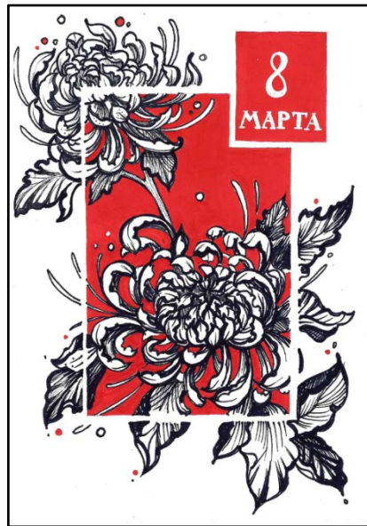
II место – открытка-зарисовка «Китайское лето». Автор – Вероника Кожина